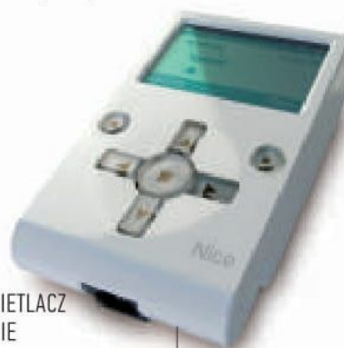
INTUICYJNY GRAFICZNY WYŚWIETLACZ UŁATWIAJĄCY PROGRAMOWANIE

Programator ustawia wszystkie parametry czujników klimatycznych serii Nemo i Volo.